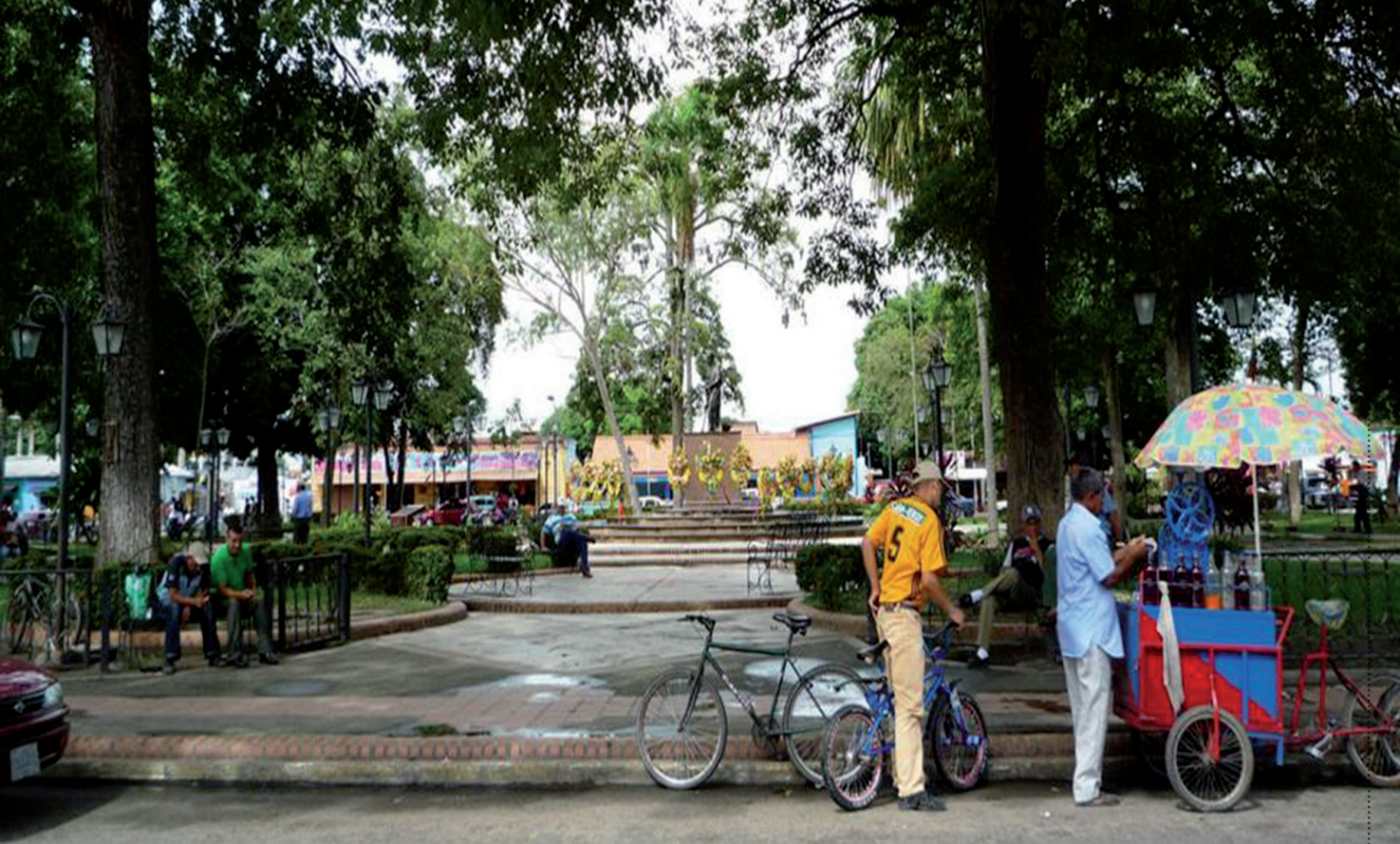
✦ Plaza Bolívar de Sabaneta, 2013.