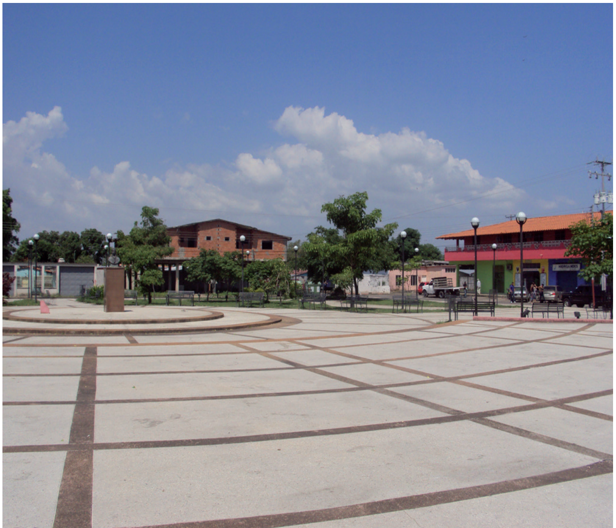
Plaza El Estudiante de Sabaneta, abril 2009.

El 28 de julio de 2014, en un acto masivo sin precedentes en la historia de Sabaneta, fue reinaugurada la plaza, esta vez con el nombre de Plaza Hugo Rafael Chávez Frías, contando con la presencia del presidente de la República Bolivariana de Venezuela, Nicolás Maduro y una larga lista de personalidades y autoridades nacionales e internacionales entre los que se encontraba el ciudadano Embajador de la República Federativa de Rusia.