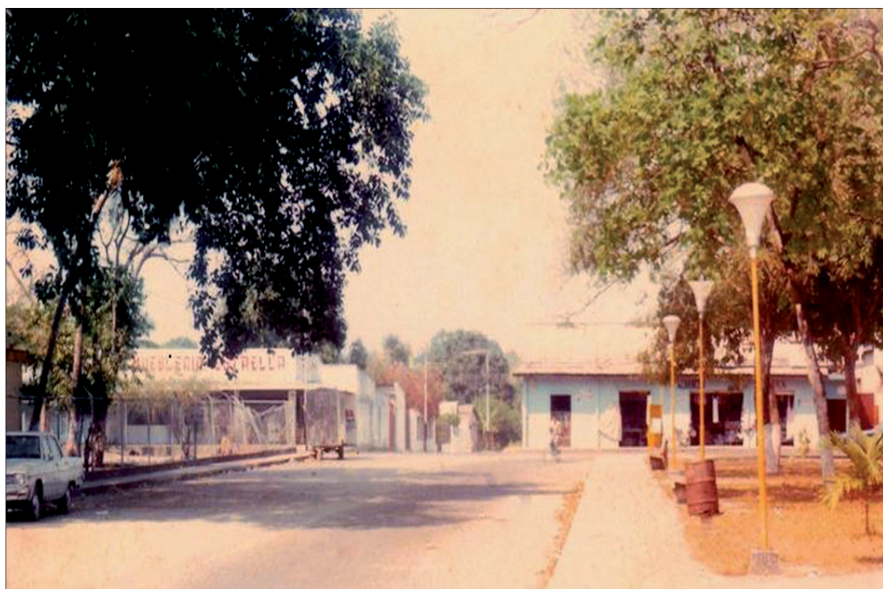
Adyacencias de la Plaza Bolívar de Sabaneta cerca de la Escuela Julián Pino, ca. 1970.